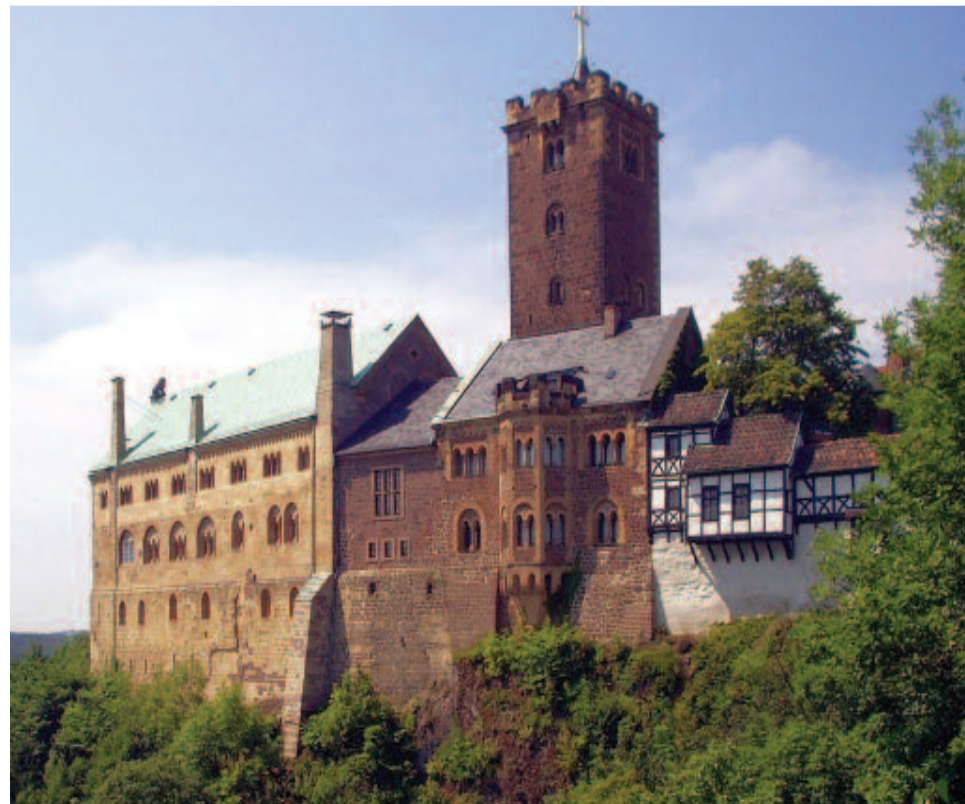
Wartburg várában fordította le Luther Márton az Újszövetséget

1509-ben a wittenbergi egyetemen tanít erkölcsefilozófiát, 1512-ben doktorrá avatják, majd átveszi a teológiai tanszéket. Belső vívódásaitól, kétségeitől továbbra sem szabadul. Legfőbb kérdése: „ Mit cselekedjek, hogy az örök életet elnyerhessem? ” Őt addig arra tanították, hogy a gyónásban megszabadul minden bűnétől, de világosan látta, hogy mennyi önzés és szeretetlenség lakik benne gyónás után is. Vergődéseiben Luther Róm 1, 17 olvasásakor értette meg Isten akaratát: „ Az igaz ember pedig hitből fog élni ”. Vagyis nem mi válunk igazzá Isten előtt érdemeink és jó cselekedeteink alapján, hanem Isten tesz igazzá bennünket az Ő kegyelméből. Ettől kezdve Luther minden tanítását ennek a felfedezésnek az öröme járta át. Ez lesz a továbbiakban a jelszava és azé a reformációé, amit ő indított el. Istennel megbékélve és lelki gyötrelmeitől megszabadulva állt mások szolgálatába. Ekkor még nem nyugtalanította feletteseit az az üzenet, mely nemsokára bombaként robbant a világba.