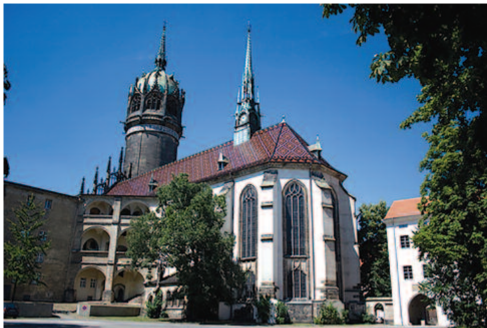
A wittenbergi vártemplom

A nap, amikor Luther tanaival felforgatta a világot, 1517. október 31. Ekkor szögezte ki a wittenbergi vártemplom kapujára 95, búcsúra vonatkozó tételét.