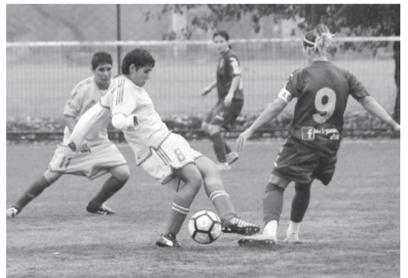
Abszolút fölényben játszottak az ASA játékosai, a legtöbb egyéni párharcukat megnyerték, a nagyarányú győzelem dacára még sincs amiért ünnepelni.

Bradićnak nem lett volna játéka. Időközben mind a két szerb légiós megvált a klubtól, vasárnap a Fair Play ellen pedig a megmaradt mind a 14 épkézláb játékos pályára lépett. Hogy még így is 11 gólt sikerült rúgni, jelzi, hogy ez a csapat több figyelmet érdemelne, s bár úgy tűnik, ez a szezon csupán